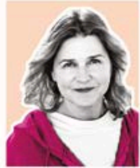
BŁECKA - KOLSKA